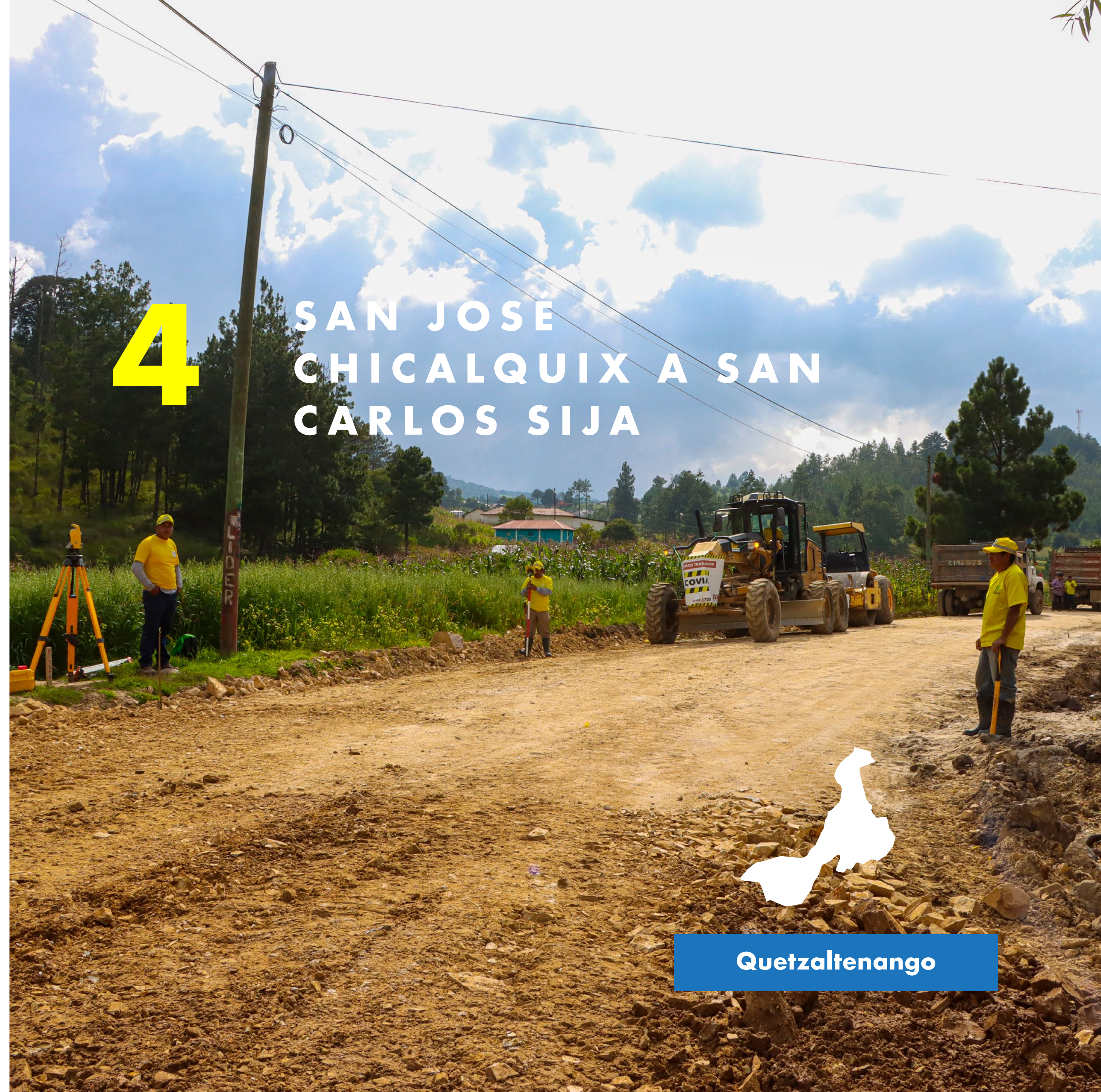
Supervisión de trabajos de pavimentación de San José Chicalquix a San Carlos Sija, Quetzaltenango.