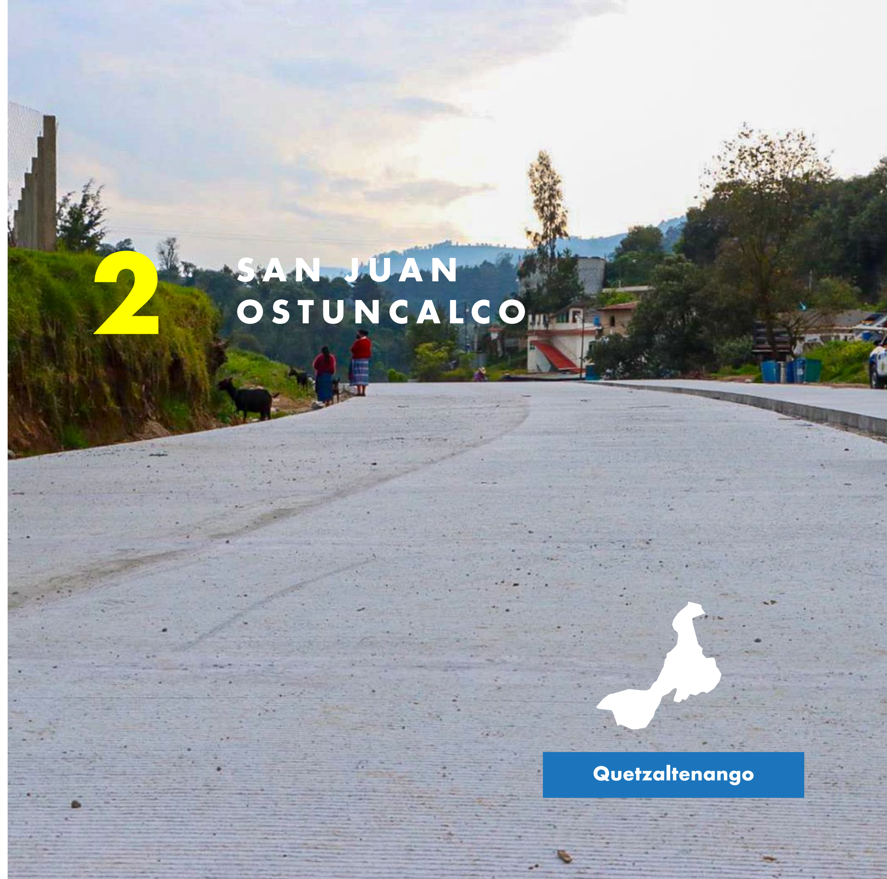
Trabajos de construcción del Libramiento de San Juan Ostuncalco, Quetzaltenango.