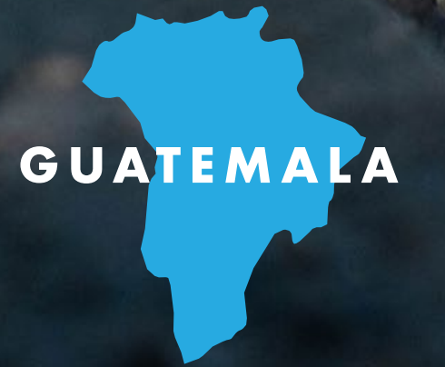
Rehabilitación de la ruta que conduce a la cabecera municipal de Fraijanes, Guatemala.