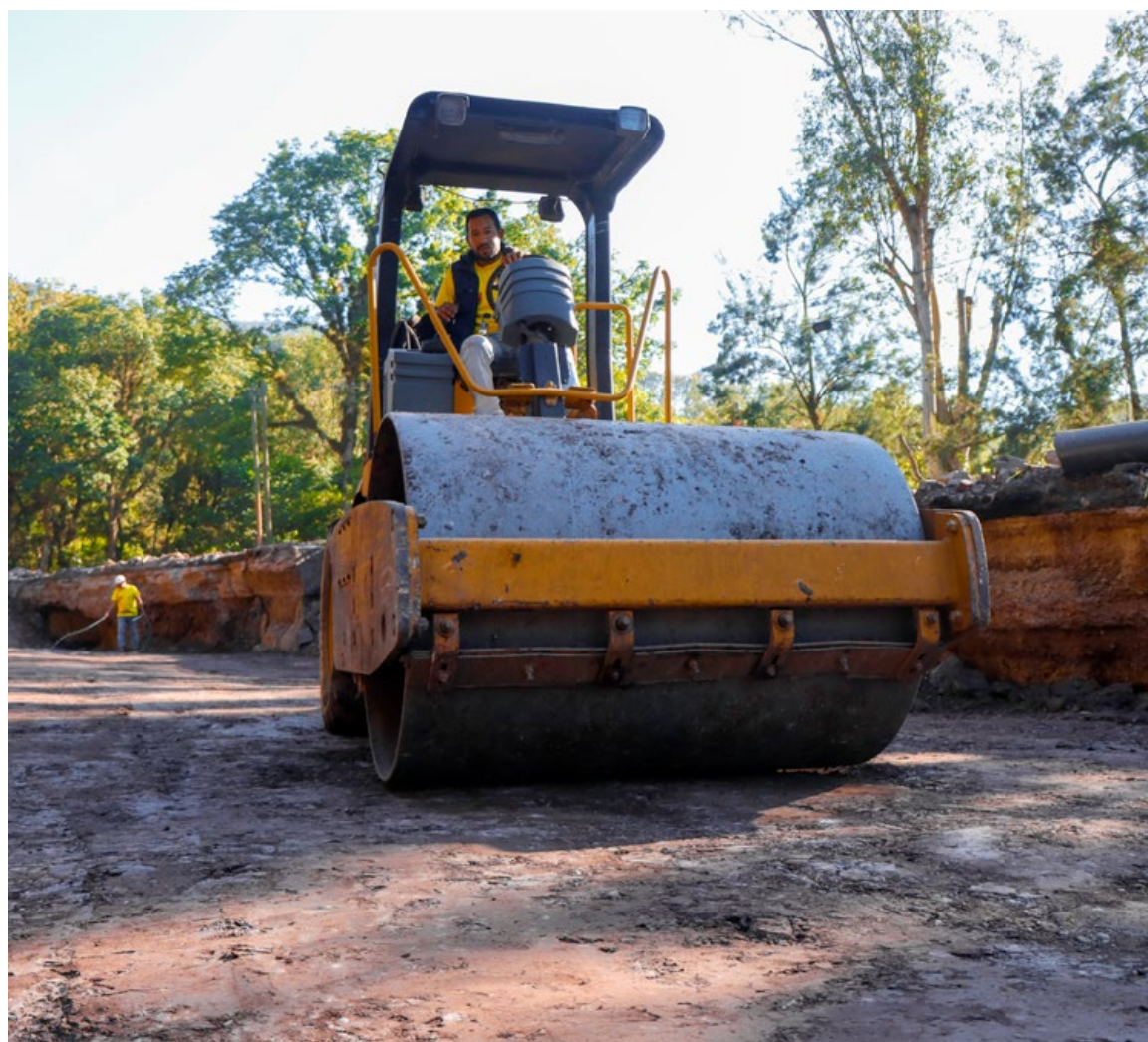
Rehabilitación por hundimiento en el Km. 216.6 de la CA-10, ingreso a Esquipulas, Chiquimula.