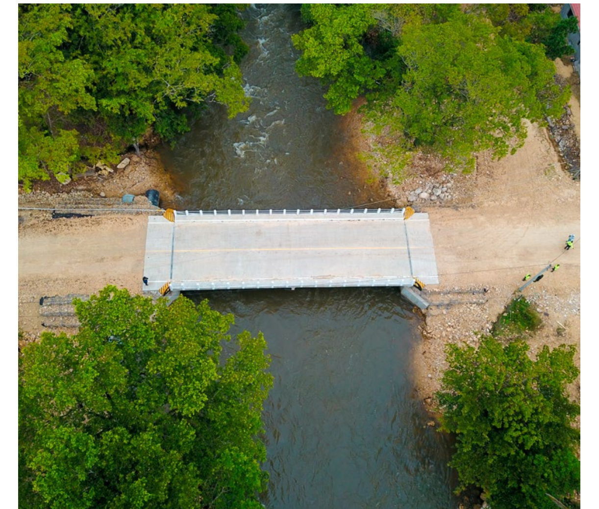
Inauguración del Puente La Reinita en Sayaxché, Petén.