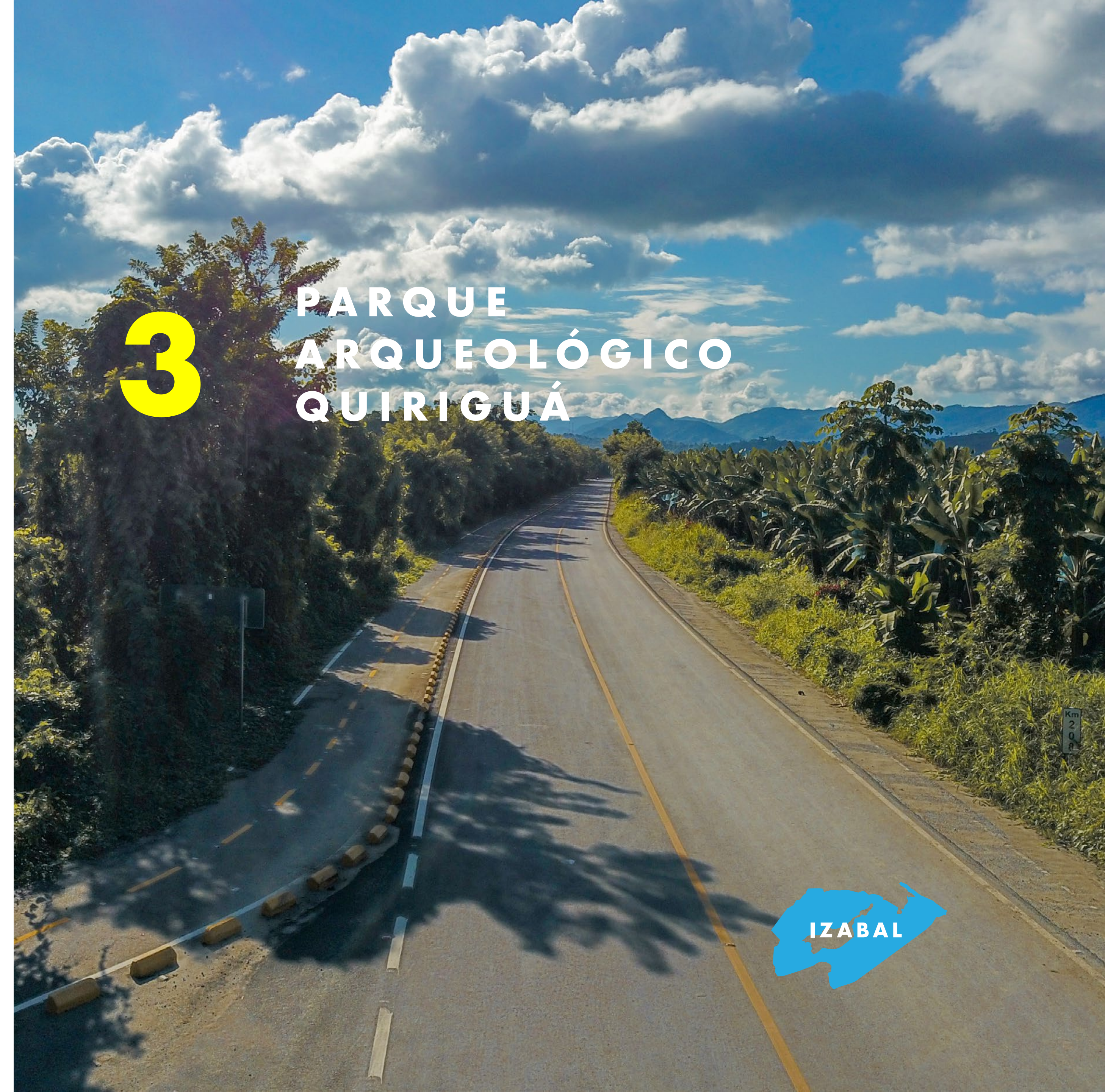
Rehabilitación de ruta que conduce al Parque Arqueológico Quiriguá, Izabal.