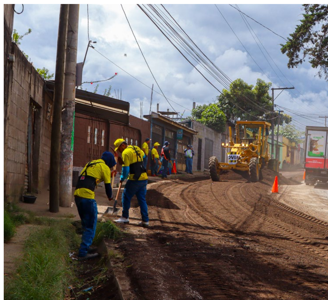
Rehabilitación de la ruta entre El Milagro, Mixco a Ciudad Quetzal, San Juan Sacatepéquez, Guatemala.