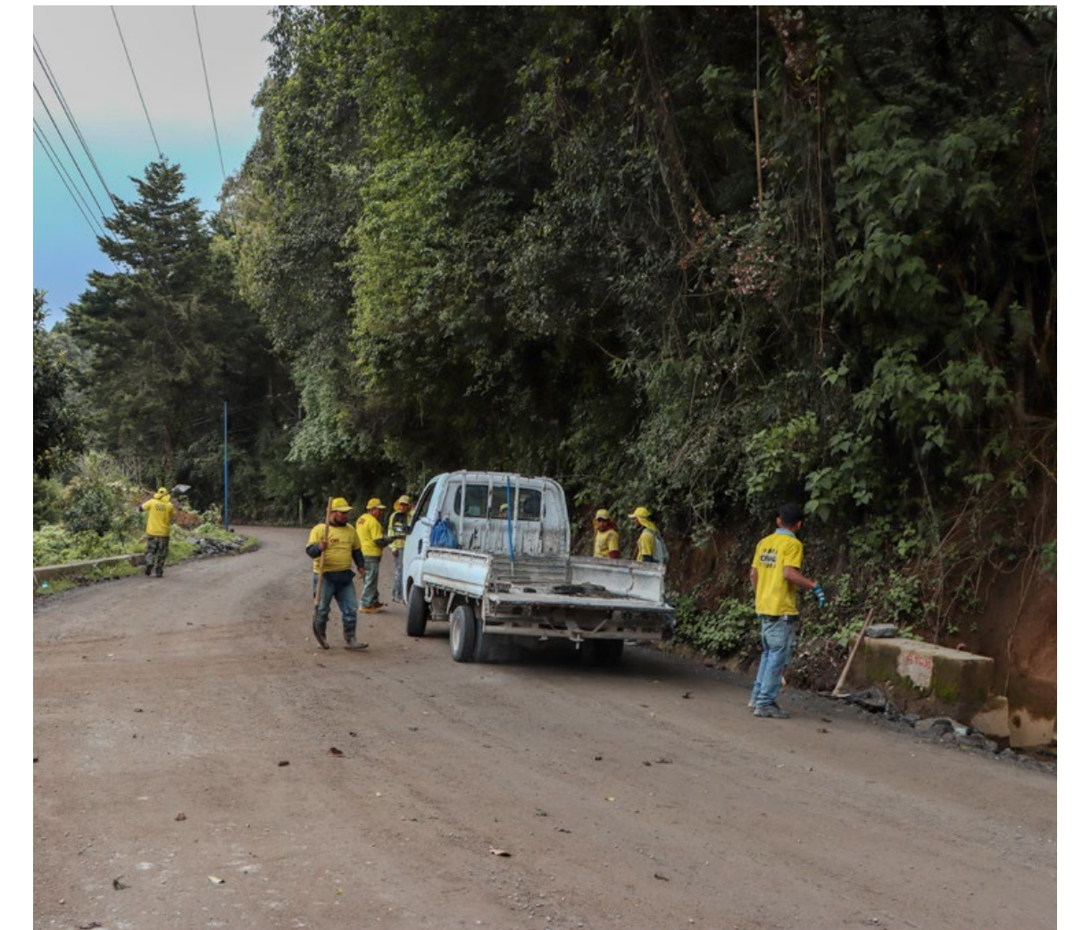
Rehabilitación de la ruta entre San Pedro Sacatepéquez, Guatemala y Santiago Sacatepéquez, Sacatepéquez.