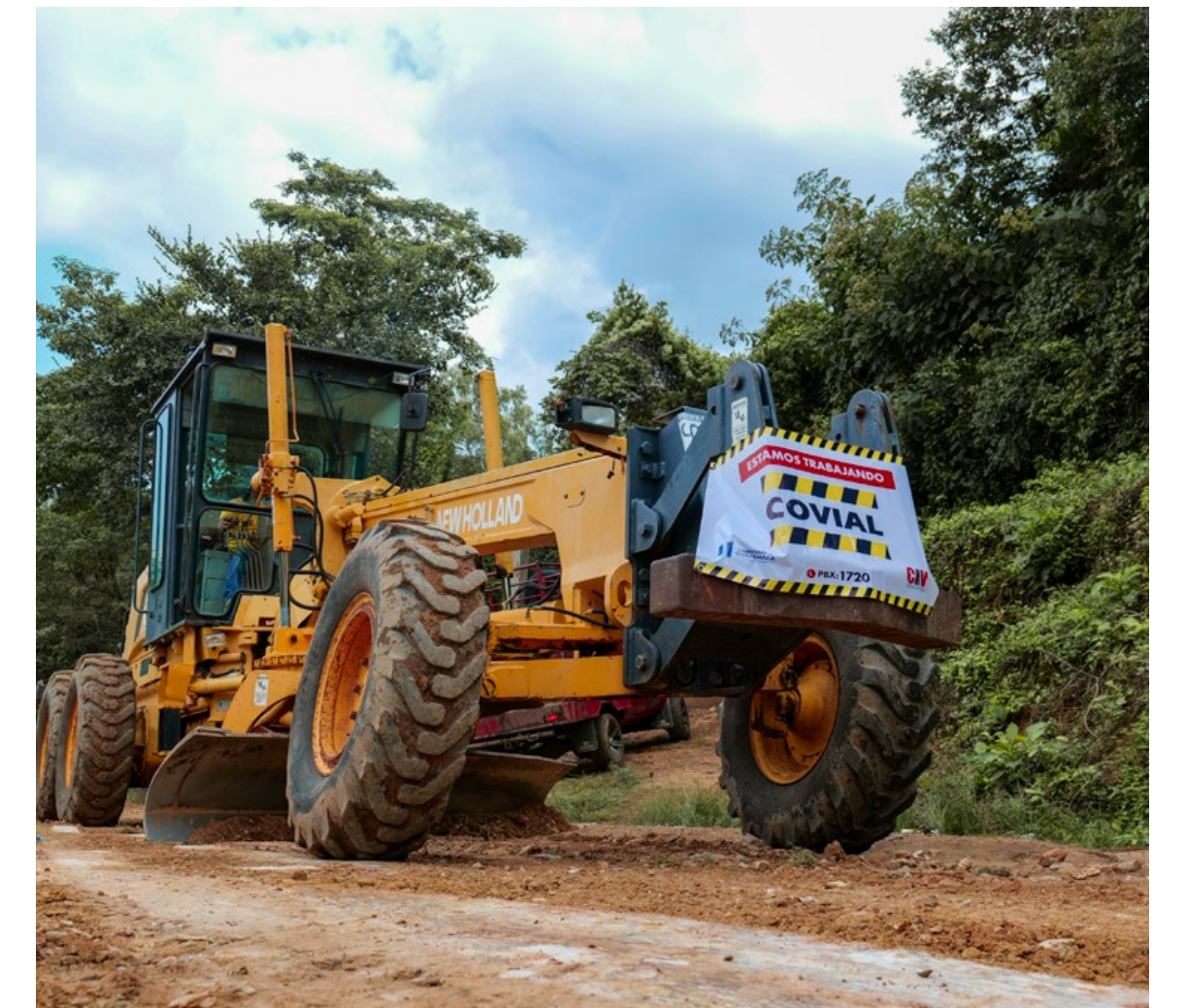
Inicio de la rehabilitación de la ruta que conduce hacia El Palmar, Chiquimula.