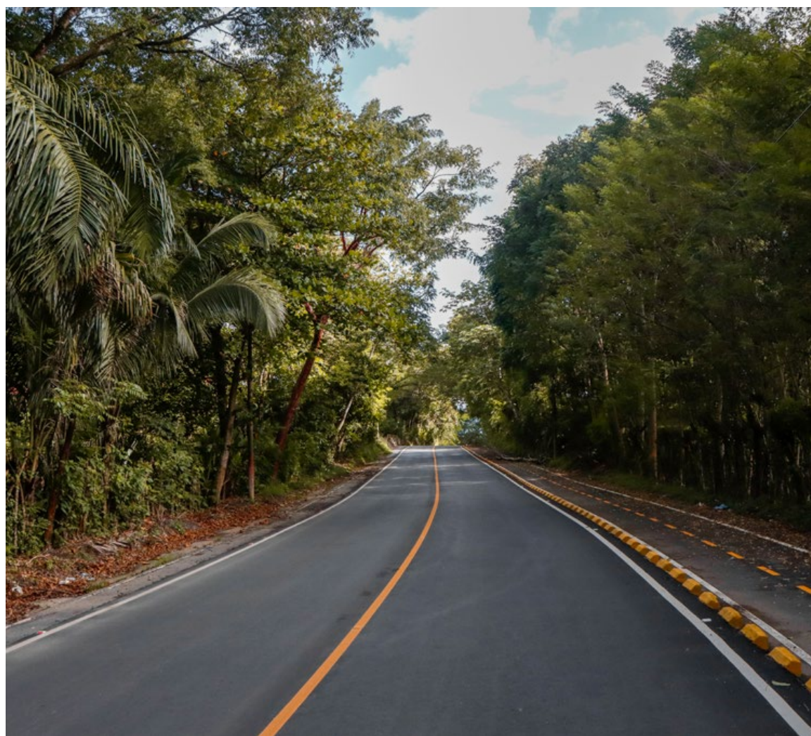
Rehabilitación de ruta que conduce hacia El Castillo de San Felipe, Izabal.