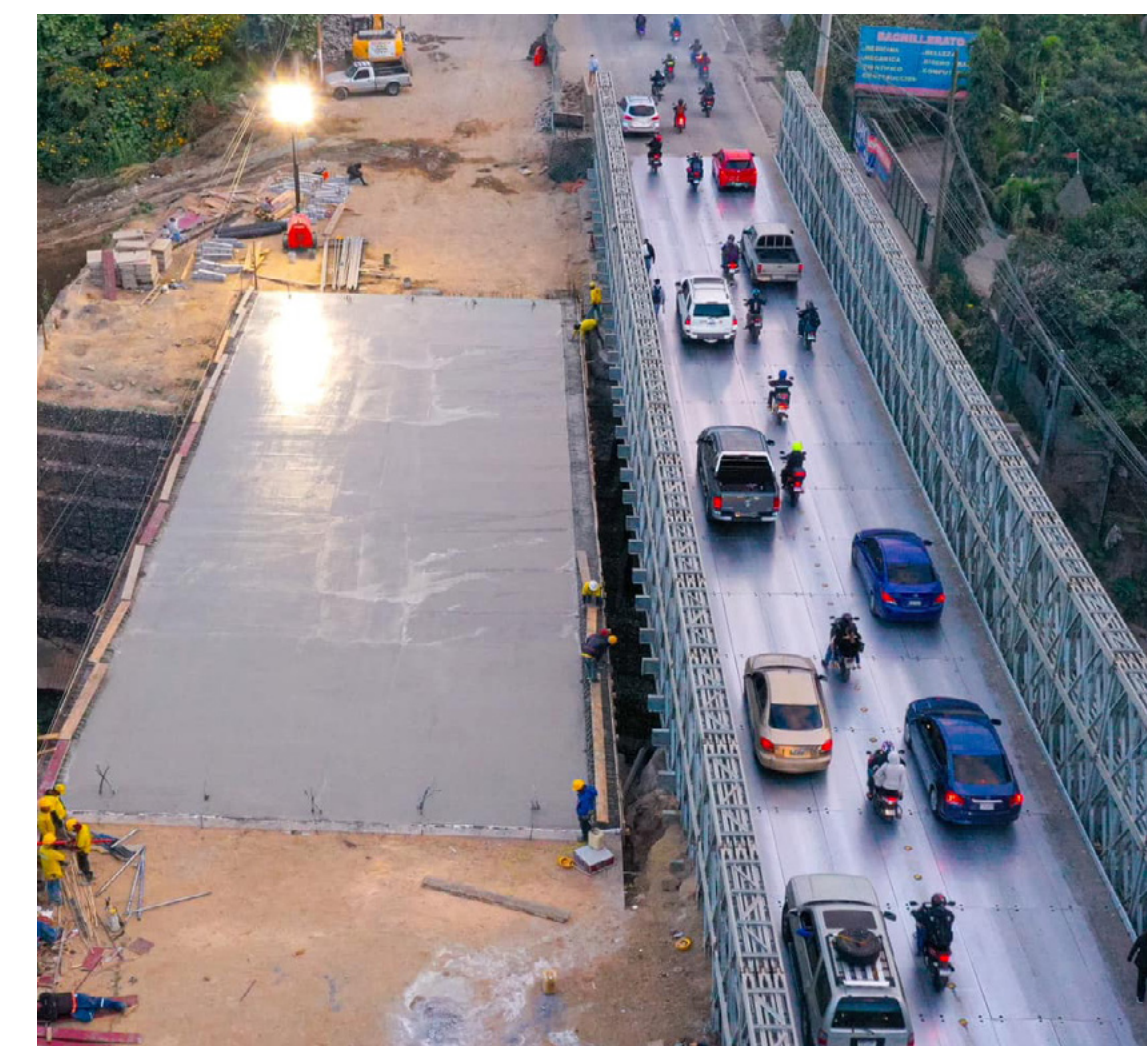
Fundición de losa de rodadura y habilitación de puente de tres carriles en el Km. 17.5 de la CA-09 Sur, Villa Nueva, Guatemala.