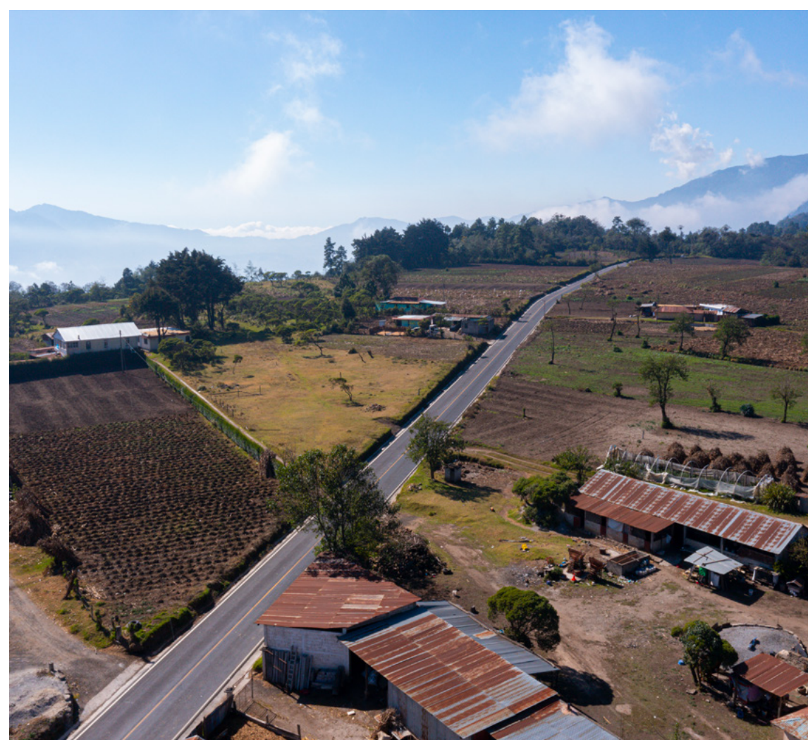
Pavimentación de la ruta entre San Miguel de los Altos y Aldea Corinto, San Antonio Sacatepéquez, San Marcos.