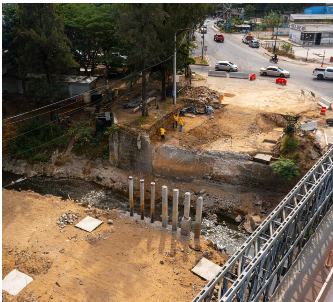
Mantenimiento y rehabilitación del Puente Villalobos I en la CA-09 Sur, Villa Nueva, Guatemala.